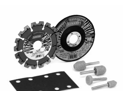
Schneid- und Schleifmittel