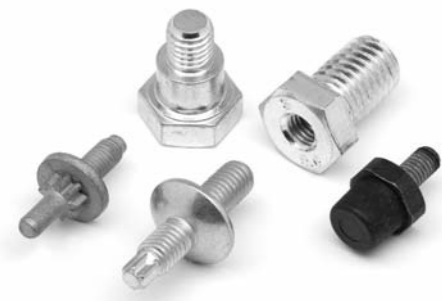
Verbindungselemente nach Zeichnung

optimieren Sie Ihr C-Teile-Management mit lieferantengebundenen Artikeln.