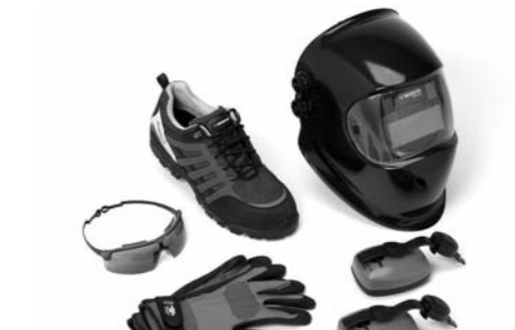
Arbeits-, Sicht- und Gehörschutz