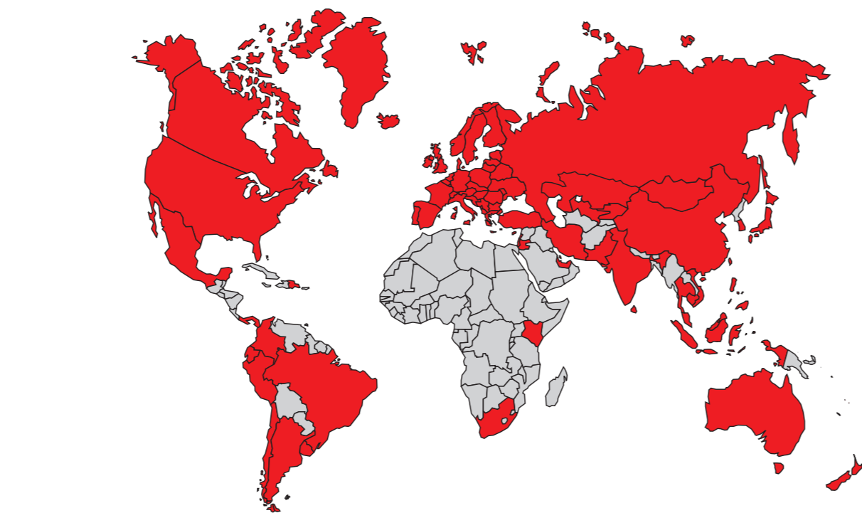
■ Länder, in denen WÜRTH vertreten ist

Wir behalten uns das Recht vor, Produktveränderungen, die aus unserer Sicht einer Qualitätsverbesserung dienen, auch ohne Vorankündigung oder Mitteilung jederzeit durchzuführen. Abbildungen können Beispielsabbildungen sein, die im Erscheinungsbild von der gelieferten Ware abweichen können. Irrtümer behalten wir uns vor, für Druckfehler übernehmen wir keine Haftung. Es gelten unsere allgemeinen Geschäftsbedingungen.