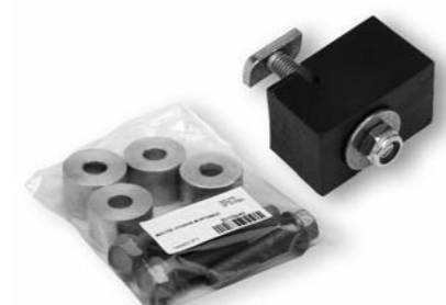
Sortimente und Baugruppen