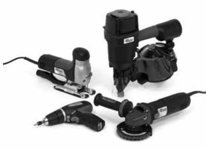
Elektro- und Druckluftwerkzeuge