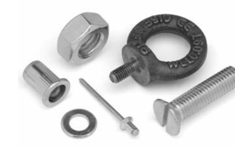
Verbindungselemente, Niettechnik und Dübel

Starten Sie mit unserem Kern-Sortiment, integrieren Sie Sonderteile und